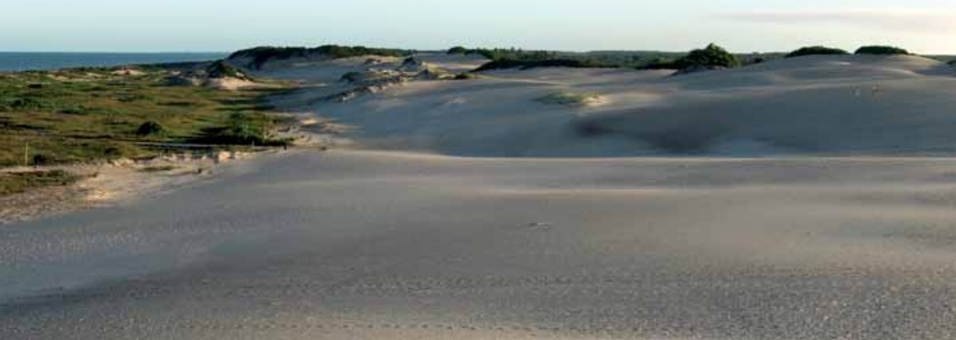
Dunas de Itaúnas