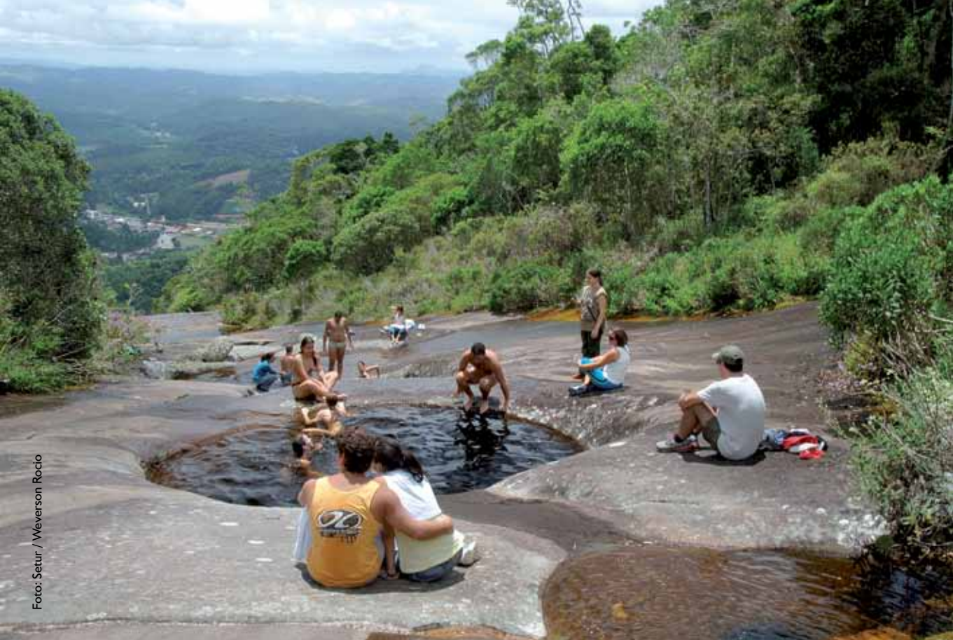
Piscinas naturais, no Parque Estadual de Pedra Azul

clima e pela grande variedade de orquídeas e sedia festas, como o Festival Italemanha.