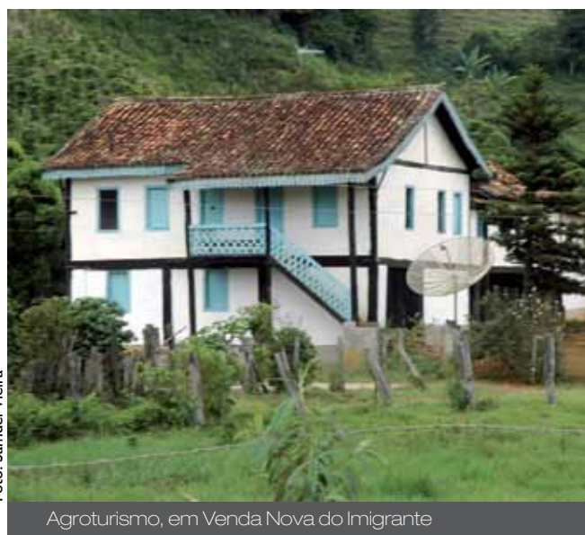
Agroturismo, em Venda Nova do Imigrante

prática do agroturismo, tornando-se uma referência nacional. Ao apreciarem os produtos típicos da região, como o socol, os turistas conhecem um pouco mais sobre os costumes e as tradições italianas. Seu principal evento é a Festa da Polenta.