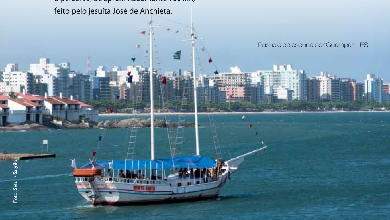
Passeio de escuna por Guarapari - ES