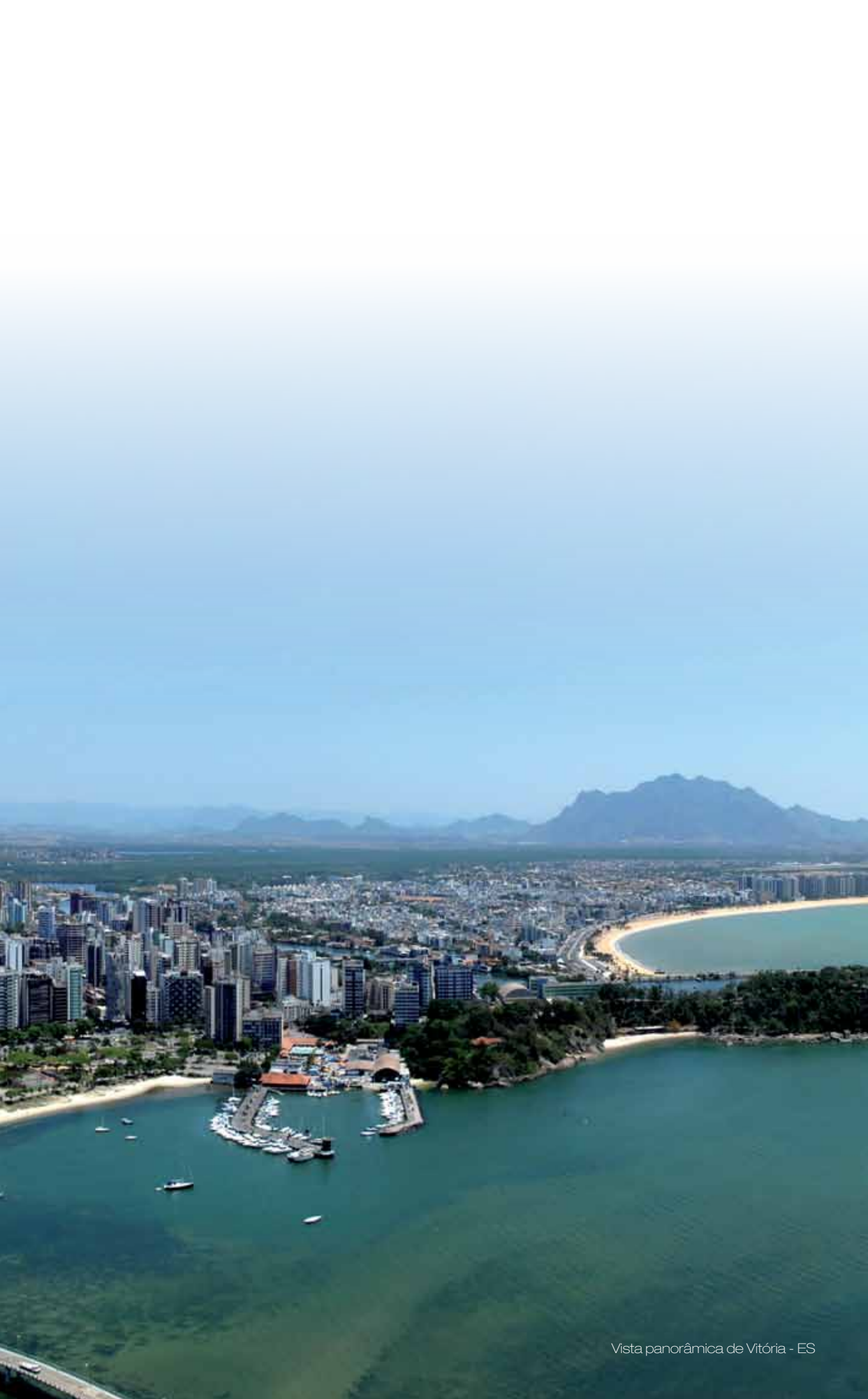
Vista panorâmica de Vitória - ES