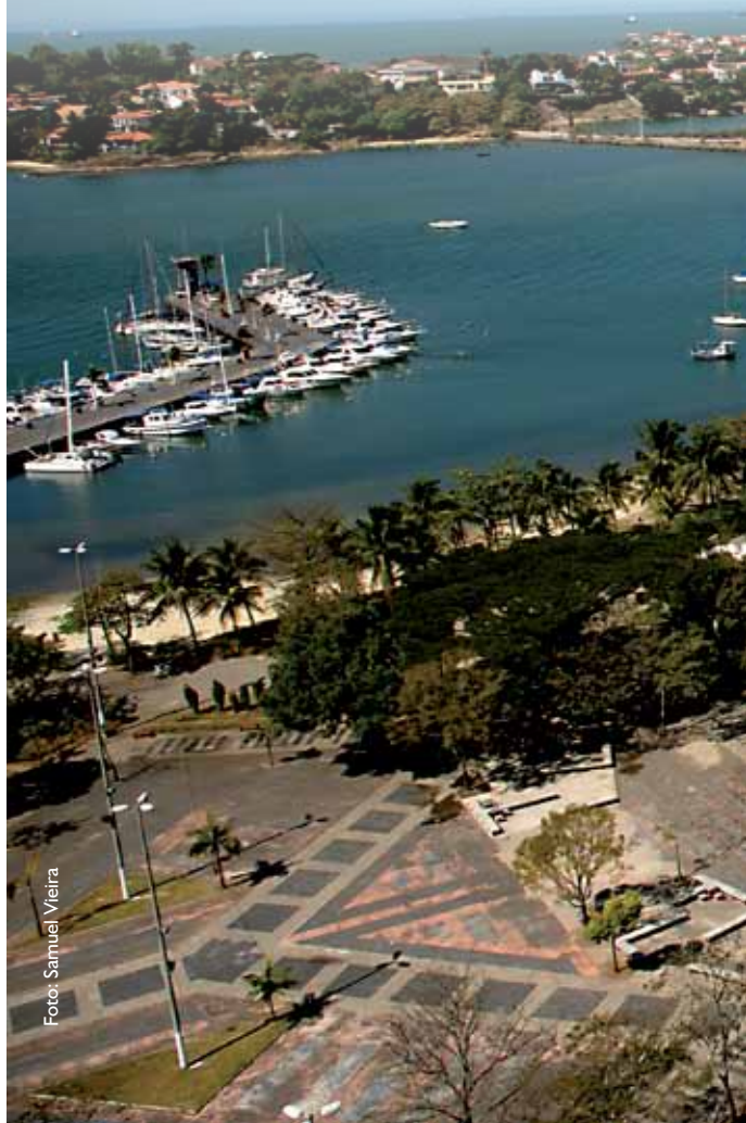
Praça dos Namorados, Vitória - ES

Fundada em 1551, a Capital do Espírito Santo conserva vários exemplares arquitetônicos da época. São casarios, igrejas, palácios e escadarias. A maior parte desse acervo está no Centro da Cidade. A riqueza de sua história, a beleza de seus parques e de suas praias – muito visadas para esportes náuticos – e suas características econômicas atraem turistas de várias partes do mundo, interessados em lazer e em oportunidades de negócios.