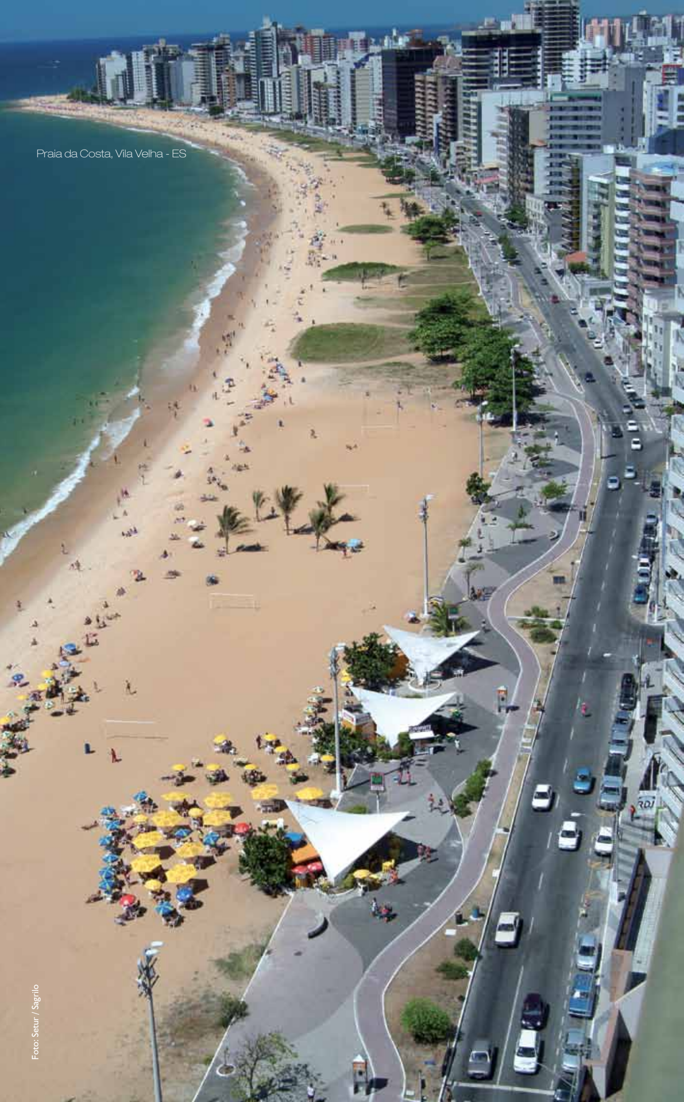
Praia da Costa, Vila Velha - ES