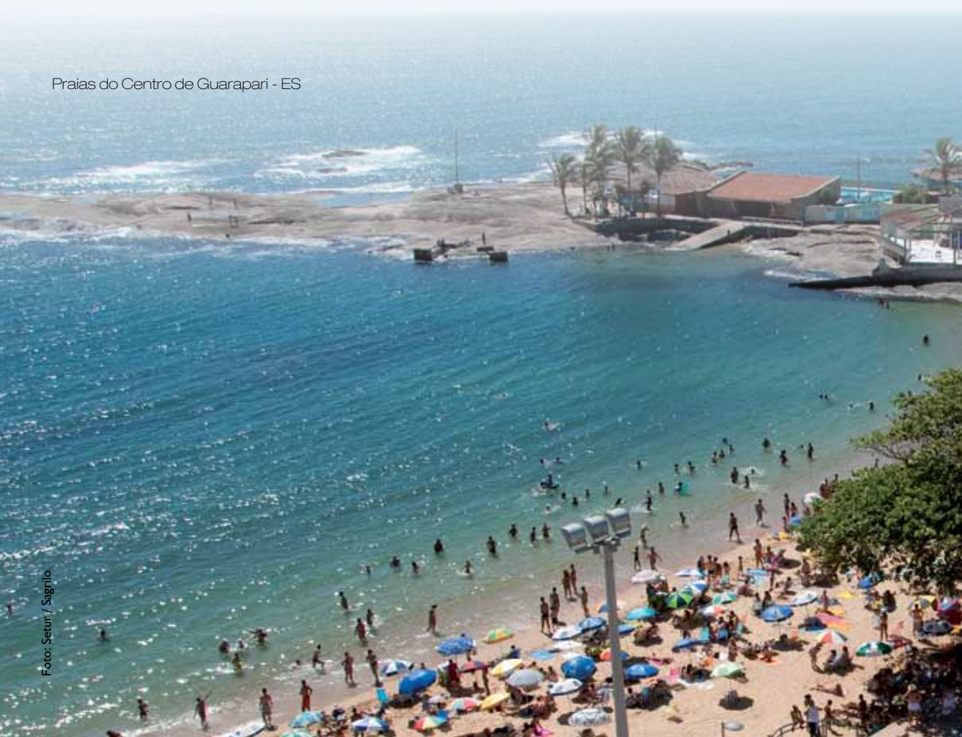
Praias do Centro de Guarapari - ES