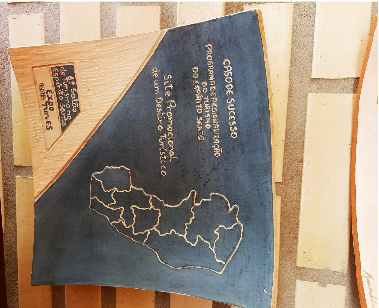
Imagem 2 – Prêmio Expotur ES – 1º Lugar Site Promocional Regional

Associação Montanhas Capixabas Turismo & Eventos CNPJ: 08 492 238/0001-93