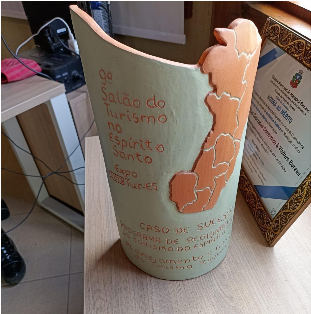
Imagem 6 – Prêmio Expotur – 1º Lugar – Planejamento e Gestão do Turismo Regional;