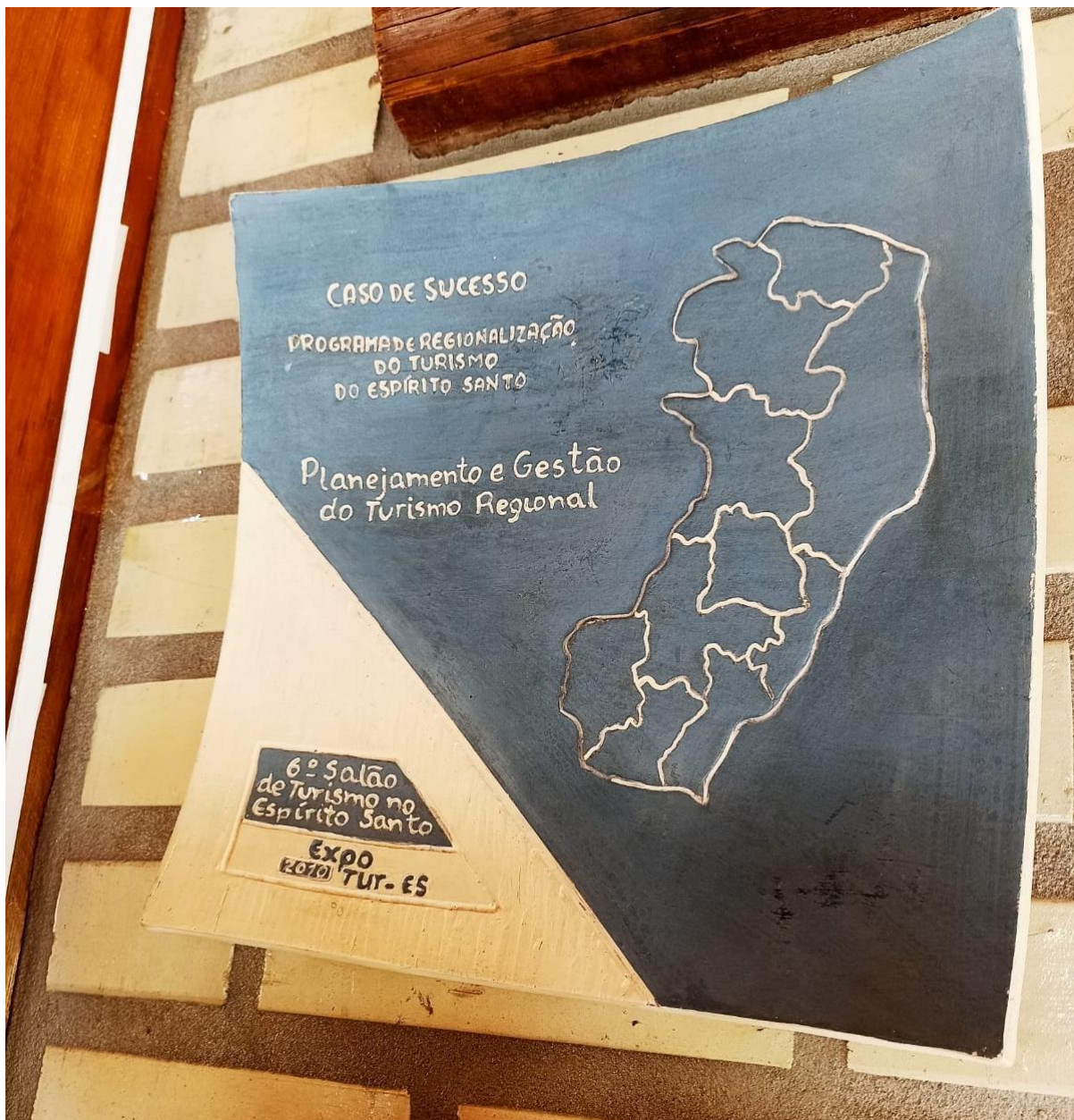
Imagem 4 – Prêmio Expotur – 1º Lugar – Planejamento e Gestão do Turismo Regional;