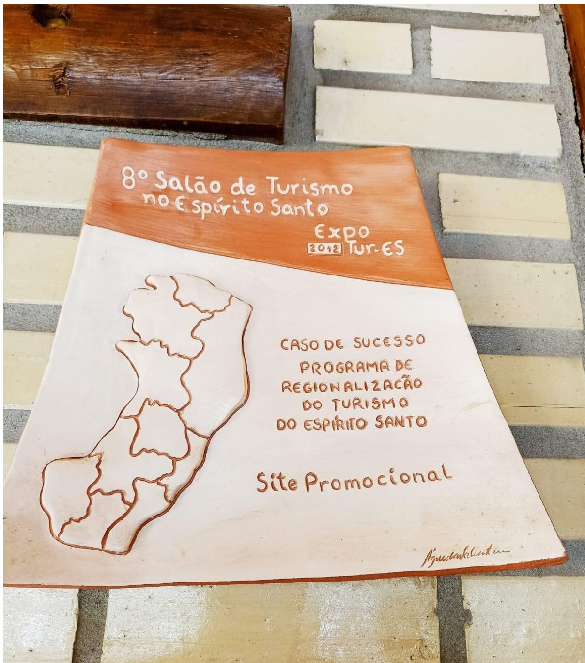
Imagem 1 – Prêmio Expotur ES - 1º Lugar Site Melhor Site Promocional Regional;