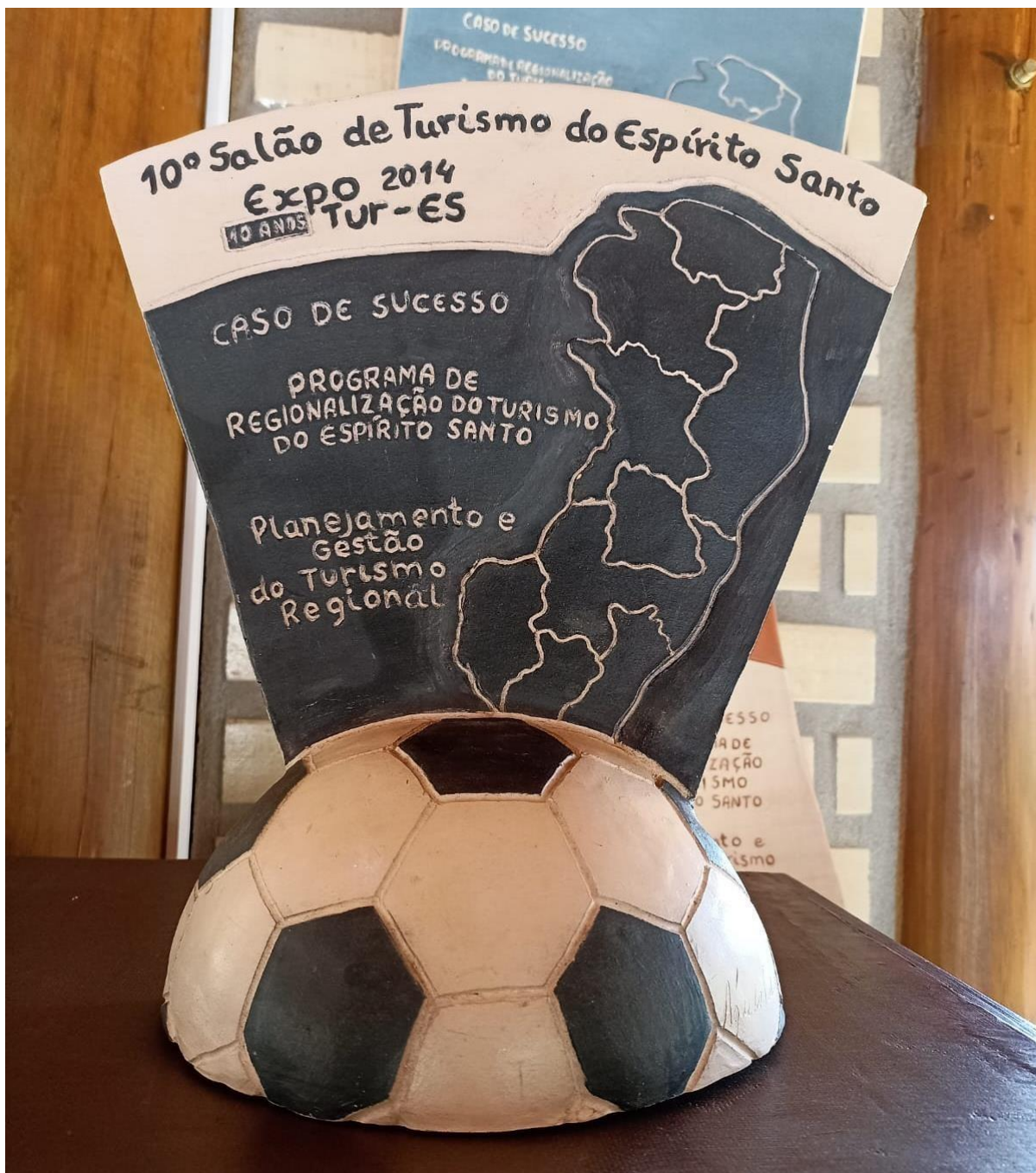
Imagem 3 – Prêmio Expotur – 1º Lugar – Planejamento e Gestão do Turismo Regional;