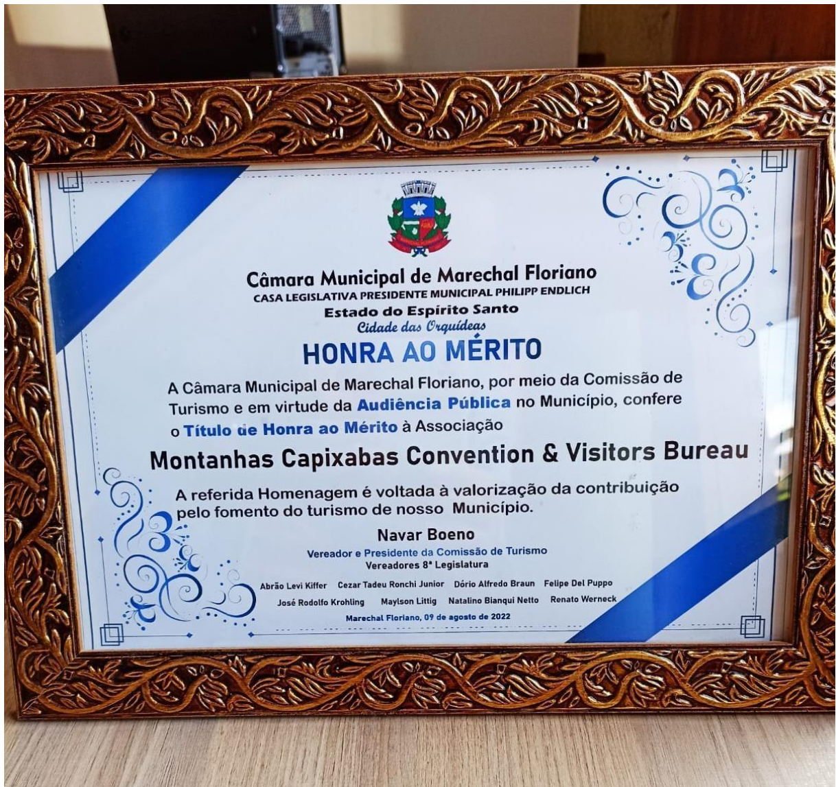
Imagem 7 – Honra ao Mérito – Homenagem pelos relevantes trabalho prestados;