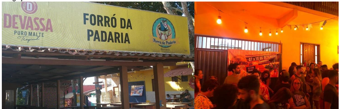
Figura 2: Fotografias do banner do Festival Gastronômico "Itaúnas & Sabores 2023", instalado no Forró da Padaria.

REALIZAÇÃO. Foi montado palco central na praça da Vila, houve presença de famílias e turistas.