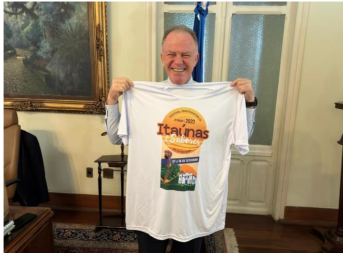
Figura 4: O governador recebeu de presente a camisa do Festival Gastronômico “Itaúnas & Sabores 2023”.