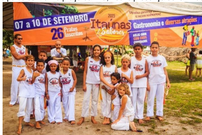
Figura 3: Fotografia do banner do Festival Gastronômico "Itaúnas & Sabores 2023", instalado no fundo do palco.

REALIZAÇÃO. Foi montado palco central na praça da Vila, houve presença de famílias e turistas.