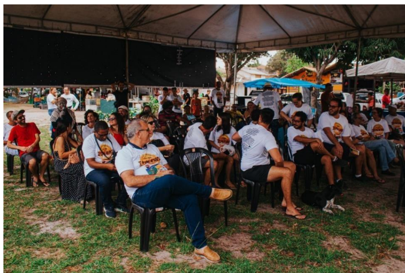
Figura 6: Abertura do Festival Gastronômico “Itaúnas & Sabores 2023”.