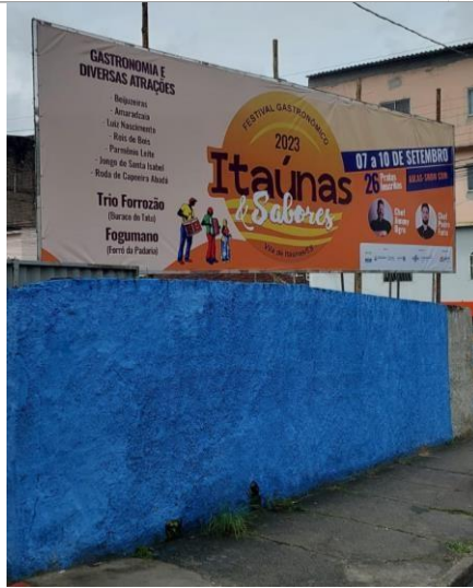
Figura 1: Fotografia instalação Outdoors do Festival Gastronômico "Itaúnas & Sabores 2023", São Mateus.