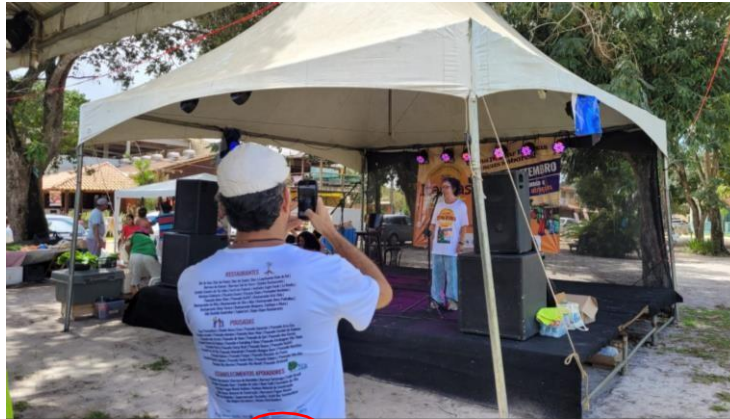
Figura 5: Registro fotográfico das camisas do Festival Gastronômico “Itaúnas & Sabores 2023”.